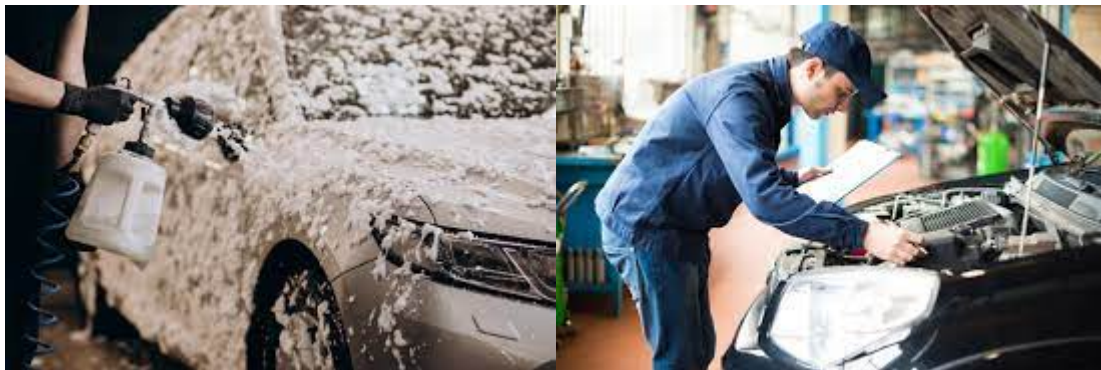
Foto 7: exemplos de serviços de responsabilidade da contratada