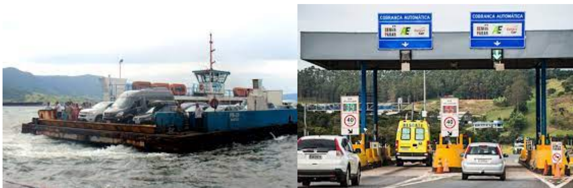
Foto 3: despesas passíveis de ressarcimento

Serão utilizadas como parâmetros para a quantificação das distâncias e do tempo de deslocamento, as informações disponibilizadas nos sítios eletrônicos do Departamento Nacional de Infraestrutura de Transportes (DNIT) e/ou órgãos estaduais congêneres, assim como do serviço Google Maps, disponível em https://www.google.com.br/maps . Para estipulação do tempo de deslocamento rodoviário, sempre será considerada a rota mais rápida indicada pelas fontes acima mencionadas.